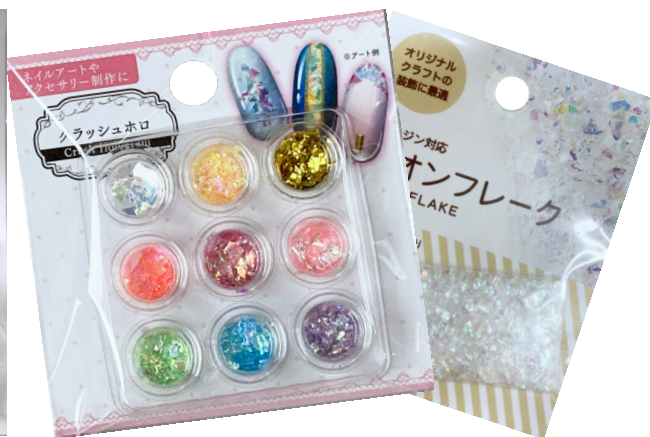
セリアネイルパーツなんでもOK