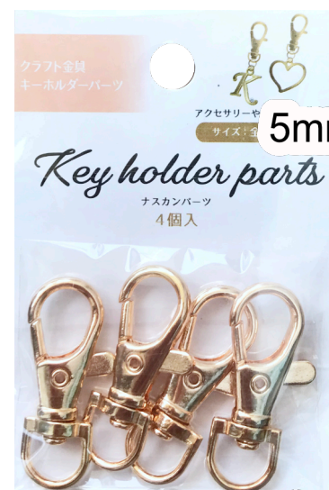
マルカンとナスカン