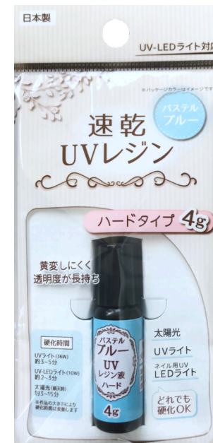
UVレジンカラーorジェルカラー